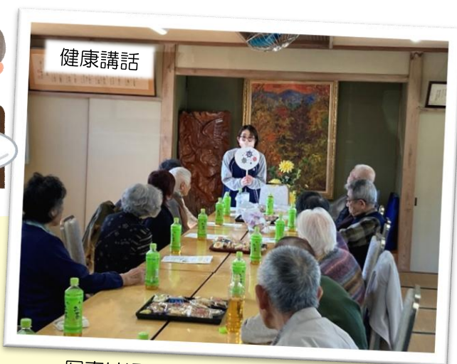
写真は過去のサロンの様子です