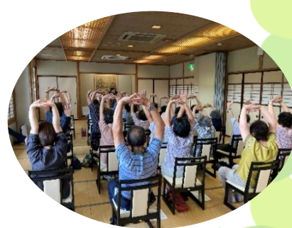
ボランティア研修会