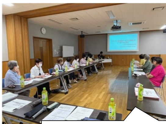
サロンボランティア研修会 (R7.6 月) 講話「介護サービスを受けるまでの流れについて」

・ボランティア活動支援や活動調整を行います。また、ボランティア同士の交流の場の提供や活動につながる研修会を行うなど、福祉活動の担い手の養成・育成を行います。