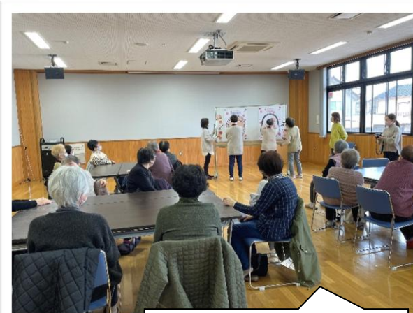
まちなかサロン (R8.1 月) 「福笑い」で楽しみました！！

・地域にある公民館や集会所などを利用し、地域のみなさんが自主的に「集いの場＝ふれあい・いきいきサロン」を運営し、仲間づくりの輪を広げ、生きがいづくりや社会参加を促進する活動の支援を行います。名立区では 8 カ所で概ね月 1 回開催していますが、新たにサロン立上げのご希望の町内会等は事務局にお問い合わせください。また、NPO 法人まちづくり未来ネット・名立が主催する誰でも気軽に集える「まちなかサロン」は名立地区公民館で毎月第 3 金曜日開催されています。(写真右)