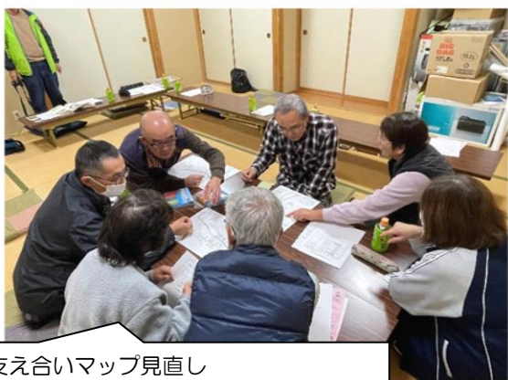
支え合いマップ見直し (上名立地区) (R7.11 月)

・地域での福祉ニーズ・課題等を把握し、その解決に向けて住民主体の福祉活動を推進するとともに、社協事業・活動の充実を図ります。 今年度も 10～11 月に開催を予定しています。 (住民福祉会との共催)