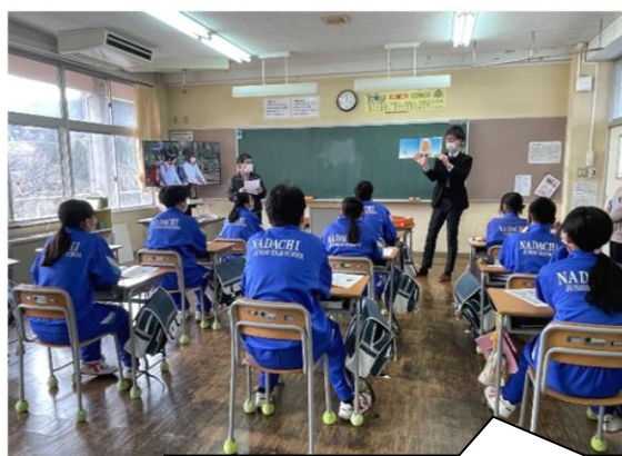
名立中学校（1 年生）で実施した 認知症サポーター養成講座 (R8.3 月)

・あらゆる世代を対象に、福祉への関心を高め、自主的に福祉活動に取り組む人材の育成につなげていきます。認知症サポーター養成講座など、ご希望の町内会や団体等は事務局にお問い合わせください。