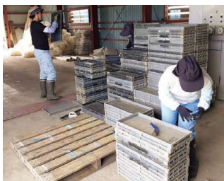
板倉ふれあい工房（就労支援事業所） 農家と連携した苗箱の洗浄作業