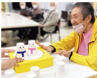
謙信高志の里（デイサービス） 心身の活性化を図るレクリエーション活動