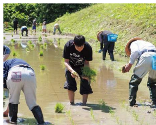
やすづが学園（フリースクール） 地域の皆さまと一緒に田植え活動