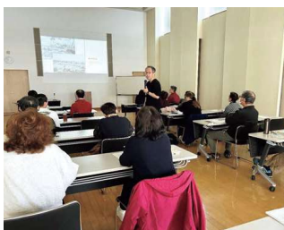
災害対策事業 災害ボランティア支援者養成講座の開催