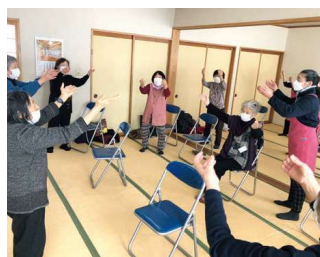
ふれあい・いきいきサロン事業 笑顔あふれる交流の場