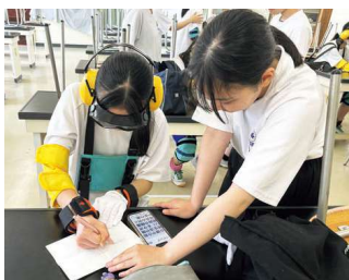
福祉教育推進事業 高齢者理解を深める体験