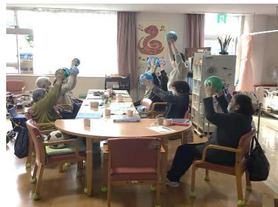
【みやじまの里清心荘】機能訓練の場所が広くなりました。