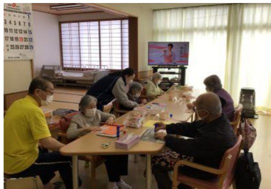
【えがおの部屋】カレンダーを作成しています。