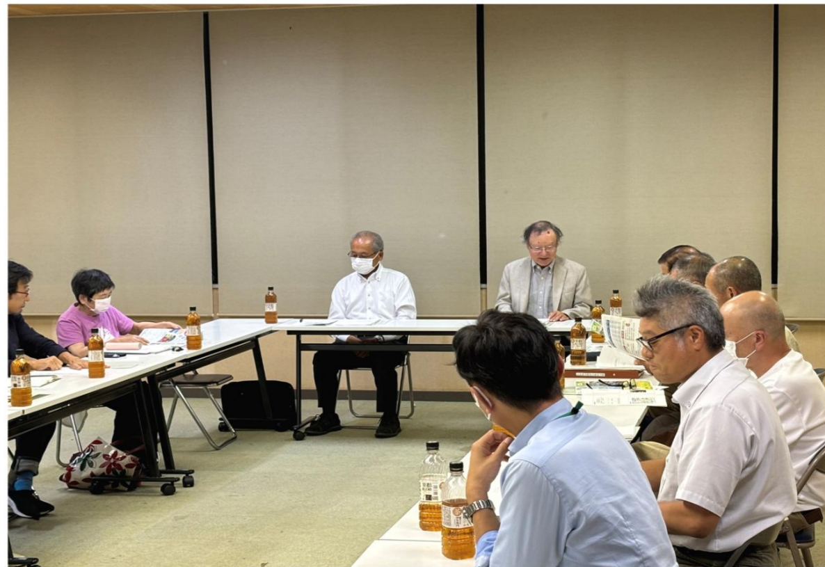
板倉区地域福祉活動計画策定委員会の様子