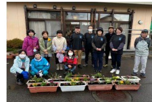
【花いっぱい運動】春の開花が待ち遠しいですね