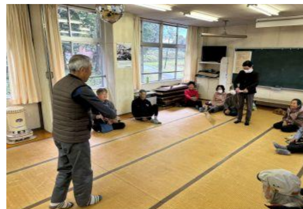
【菰立サロン】どちらが早くひもを巻けるか競争をしました