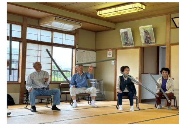
【熊川サロン】棒を使って体操をしました