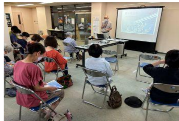
【ボランティア研修会】お薬について学びました