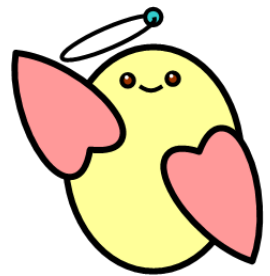
社協マスコット・めくりん