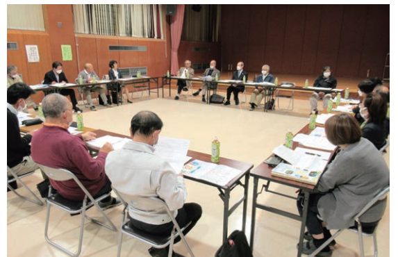
地区地域福祉活動計画策定事業

株式会社 ヤモリ 有限会社 東頸設備 株式会社 スマイルリゾートキュービットパレイ 有限会社 新清興業 株式会社 栄鵬建設 有限会社 内山商会 長倉工易 有限会社 株式会社 北島車輛 新潟県建設業協会 安塚支部 パル設計 有限会社 有限会社 丸田商事 上越技研 株式会社 有限会社 東自動車商会 浦川原診療所 新潟第一酒造 株式会社 株式会社 郷土建設藤村組 三星工業 株式会社 浦川原工場 大陽開発 株式会社 株式会社 カスガ 株式会社 武江組 株式会社 蓑和土建 株式会社 自然芋そば