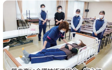
質の高い介護技術で安全・安心に