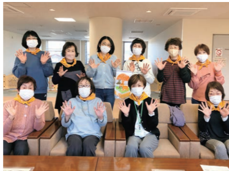
チームオレンジおがたの皆さん

ばっちりです! チームのメンバーのなかには、うみまち茶屋が開所した当時からボランティアとして活動している方もいるので、地域の方々も安心して楽しくお話をされています。 また、チームオレンジの活動以外にも、地域サロンのスタッフとして活動したり、県立水と森公園の応援ボランティアとして活動したりして、メンバーの皆さんは地域の様々な場面で活躍されています。 今後は、さらにメンバーを増やして認知症カフェ以外にも活動を広げていきたいと話されています。 認知症になってもならなくてやさしいまちの実現に向けて、今日も元気に「チームオレンジおがた」のみなさんは活動されています。