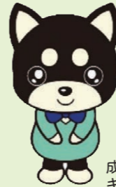
成年後見制度 キャラクター “後犬ちゃん”

このセンターは、誰もが住み慣れた地域でその人らしい生活をおくることができるよう「成年後見制度」の利用相談、支援を行う窓口です。上越市から委託を受けて上越市社会福祉協議会が運営しています。どうぞお気軽にご相談ください。