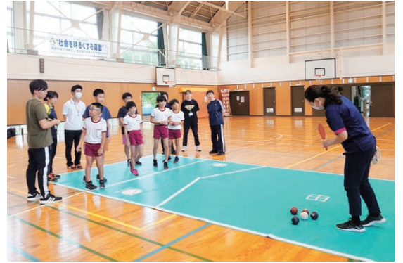
住民福祉会 福祉教育事業「福祉を学ぶ」

株式会社 荷屋建設 医療法人社団 五十嵐医院 株式会社 渡辺板金 株式会社 サトウ産業 つくし工房 医療法人社団 斉藤医院 久保田建設 株式会社 さくらメディカル 株式会社 株式会社 東光クリエート 株式会社 平林塗装 株式会社 トクサス 株式会社 城東電工 公益社団法人 上越市有線放送電話協会 株式会社 ヤマダトータル エスピーガーリック食品 株式会社 高田工場 株式会社 岡田測量 株式会社 高橋建設 株式会社 タマルヤ 新潟県厚生農業協同組合連合会 上越総合病院 株式会社 上越工産 株式会社 岩の原葡萄園 立入住設 株式会社 リコージャパン株式会社 新潟支社 上越事業所 株式会社 幸村萬治商店 有限会社 増井オート 上越ヤクルト販売 株式会社 株式会社 新潟日報社 上越支社 株式会社 一印上越魚市場 丸運建設 株式会社 上越支店 上新開発 株式会社 株式会社 サポートワン 株式会社 上越自動車学校 えちご上越農業協同組合 岡庭商行 株式会社 株式会社 ナルス 本部 株式会社 荻谷商店 株式会社 サトコウ 株式会社 大杉屋惣兵衛 株式会社 上越メンテナンス 有限会社 藤田新聞販売会社 株式会社 みやした 株式会社 高菱 宗教法人 善念寺 医療法人社団 渡辺内科医院 くびき野バス 株式会社 ワタナベ美容室