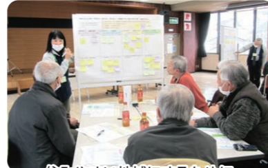
住みやすい地域にするために