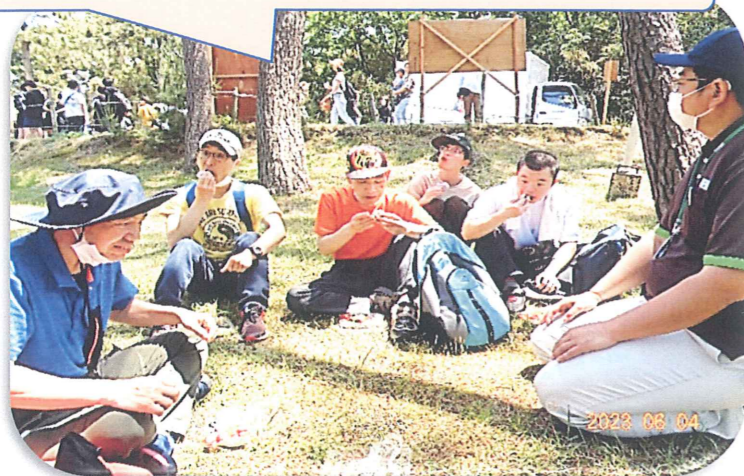
天気の良い休日は、ピクニックもいいですねえ