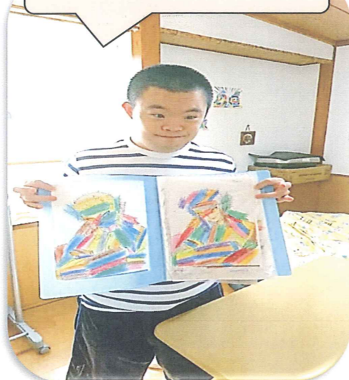
カラフルな作品ですね!!