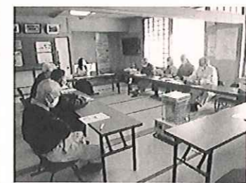
サロン「くまだ倶楽部」 保健師さんによる健康講話

現在、大島区では6会場が登録され、それぞれの会に合わせたサロンが開催されています。