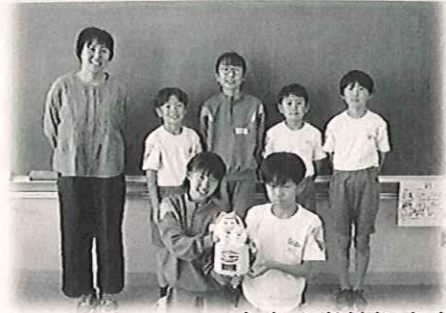
大島小学校児童会