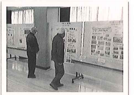
「福祉事業所・団体活動紹介、展示」