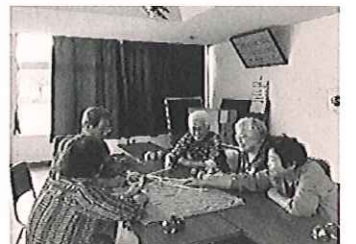
大島お達者クラブ レクリエーション