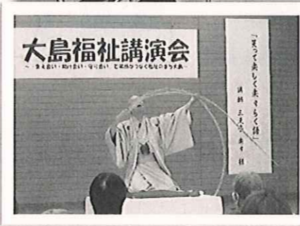
「さては南京玉すだれ〜♪」

落語『時そば』のそばをすすする仕草や、『初天神』では「どうちゃんあれ買って～」と次から次へと展開し流れるようなお噺に会場が笑い声でいっぱいになりました。また、楽しいお噺の間に、今も増え続けている特殊詐欺の手口や防止策についても教えていただきました。