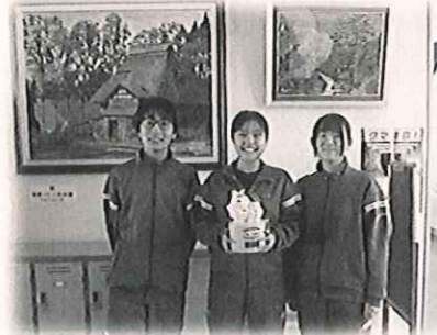
大島中学校生徒会