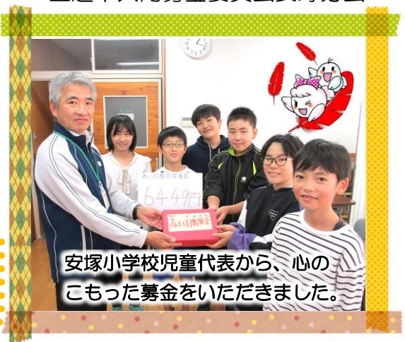
安塚小学校児童代表から、心のこもった募金をいただきました。

この募金は、安塚区の地域福祉事業、県内の社会福祉施設や団体の行う福祉活動、災害支援等に活用させていただきます。