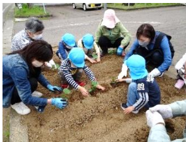
きゅうり、なす、トマト… いろいろな野菜を植えました

その後、年長児には 高齢者との心のふれあいをテーマにした「おっぴちゃんはまほうつかい」、ゴミ・環境問題がテーマの「どんぐりころころ」という2つの紙芝居を見てもらいました。