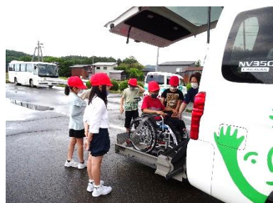
車椅子のまま車に乗ることが できるんだね