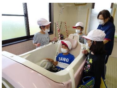
座ったまま入れるお風呂 「チェア浴槽」を体験