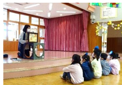
どんぐりタロウが遊びに行った池は、 人間が捨てたゴミがいっぱいで…