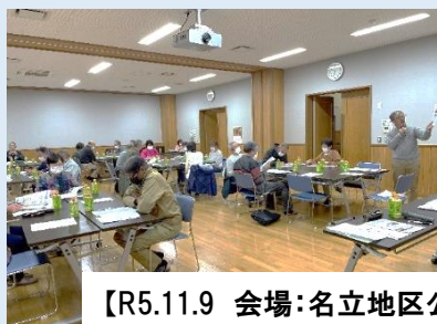
【R5.11.9 会場:名立地区公民館】

毎年、名立区住民福祉会と上越市社会福祉協議会名立支所の共催で開催している地域福祉懇談会について、今年度も町内会長、福祉委員、民生委員児童委員、地域福祉推進委員、いきいきサロンスタッフのみなさんからご参加いただき、左記日程のとおり開催しました。