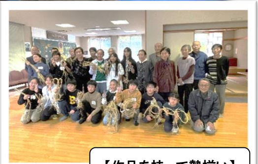
【作品を持って勢揃い】

これからも多くの皆さんが参加していただけるよう、ご希望をお聞きしながら実施していきたいと考えています。