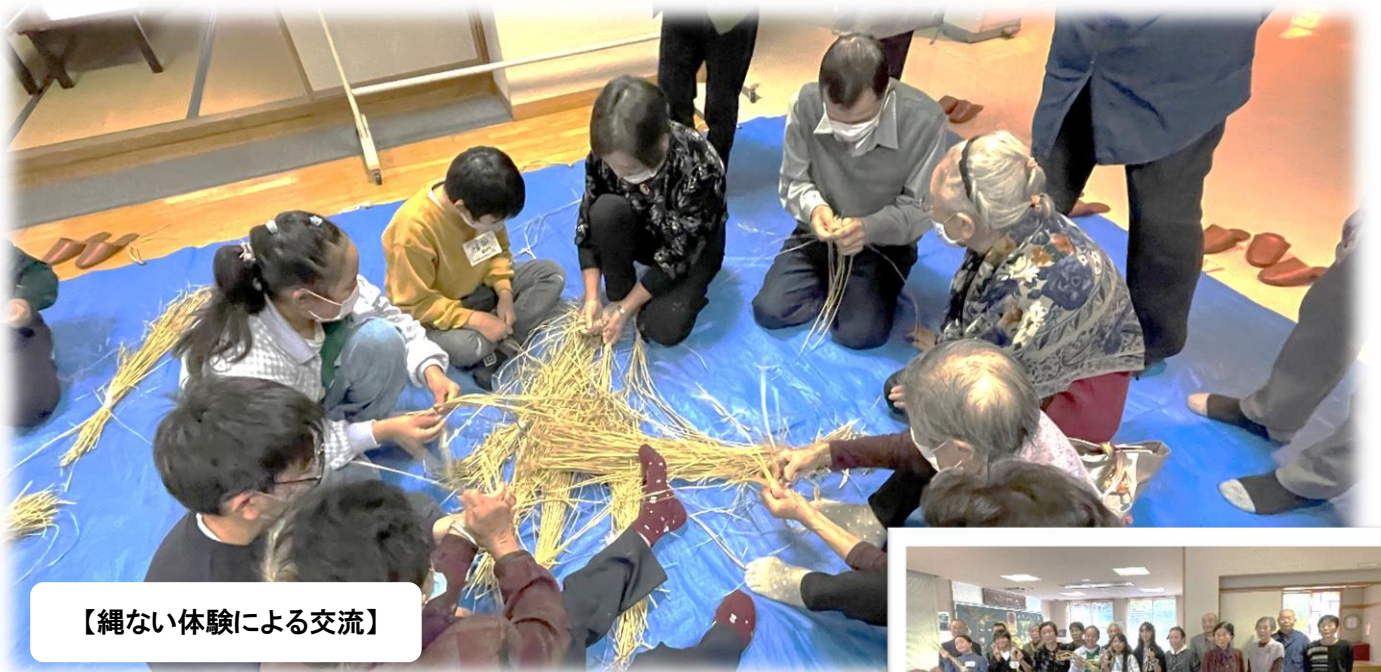
【縄ない体験による交流】

11月13日（月）、ろばた館において、名立区住民福祉会主催、上越市社会福祉協議会名立支所共催の令和5年度第1回高齢者ふれあい交流会が開催されました。