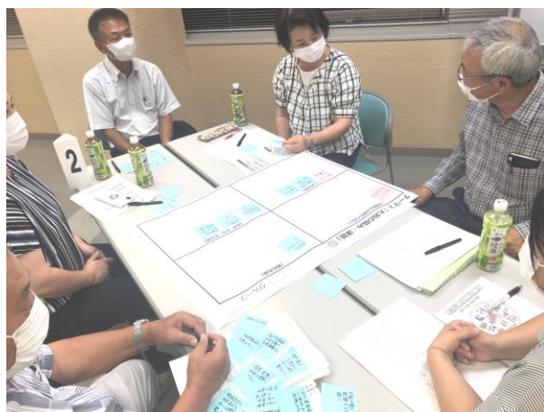
第1回地域懇談会の様子

この計画の策定に向けて、地域懇談会やアンケートなどで地域の皆様や小中学生の“想いや声”をお聞きし、検討を進めています。