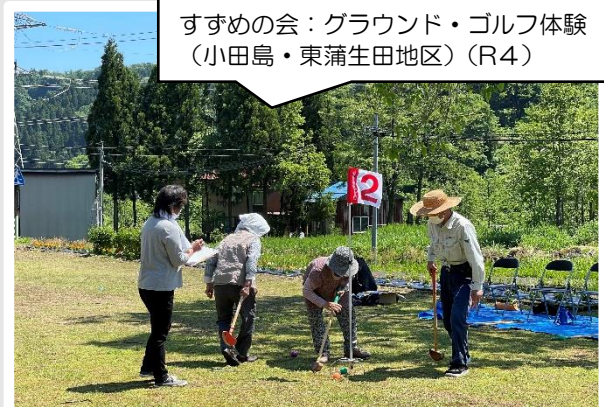
すすめの会：グラウンド・ゴルフ体験 (小田島・東蒲生田地区)(R4)

・地域にある公民館や集会所などを利用し、地域のみなさんが自主的に「集いの場」を運営し、仲間づくりの輪を広げ、生きがいつくりや社会参加を促進する活動の支援を行います。