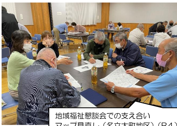
地域福祉懇談会での支え合い マップ見直し(名立大町地区)(R4)

・地域での福祉ニーズ・課題等を把握し、その解決に向けて住民主体の福祉活動を推進するとともに、社協事業・活動の整備・充実を図ります。 (住民福祉会との共催)