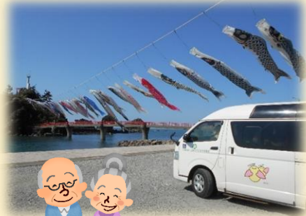
◀お天気の良い日にドライブ!!

名立デイサービスセンター椿寿苑では、食事、入浴などの日常生活支援をはじめ、機能訓練や様々なレクリエーションを行い、その人らしさを大切に、ご利用者様個人の目標に合わせたサービスをご提供します。