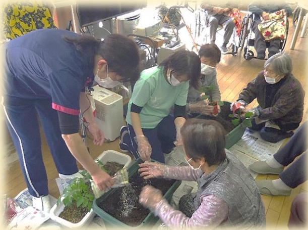
▲プランターに野菜植え、ご利用者さんが先生です。キュウリ、ナス、トマト etc 早く大きくなあれ!!

名立デイサービスセンター椿寿苑では、食事、入浴などの日常生活支援をはじめ、機能訓練や様々なレクリエーションを行い、その人らしさを大切に、ご利用者様個人の目標に合わせたサービスをご提供します。