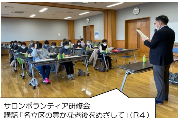
サロンボランティア研修会 講話「名立区の豊かな老後をめざして」(R4)

・ボランティア活動支援や活動調整を行います。また、ボランティア同士の交流の場の提供や活動につながる研修会を行うなど、福祉活動の担い手の養成・育成を行います。