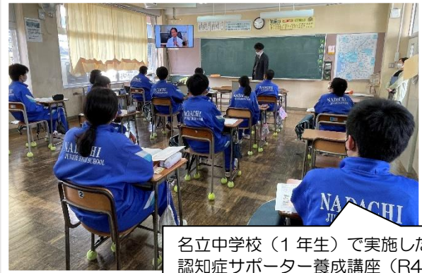
名立中学校(1年生)で実施した 認知症サポーター養成講座(R4)

・あらゆる世代を対象に、福祉への関心を高め、自主的に取り組む福祉活動を推進する人材の育成につなげていきます。