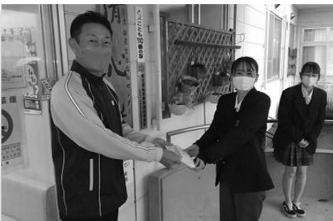
2 上越市社協 板倉支所だより

ふれあい祭り(ヤンニウムチキン)の売上の一部を赤い羽根共同募金とふれあい工房に配分させていただきました。