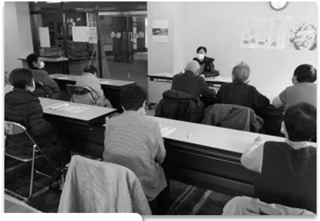
すこやかサロンの活動の一部