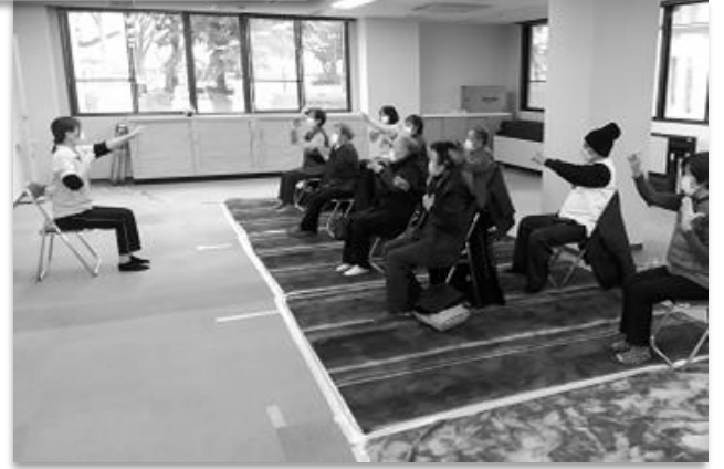
【皆で楽しく活動しています。一緒にサロンに参加しませんか？】