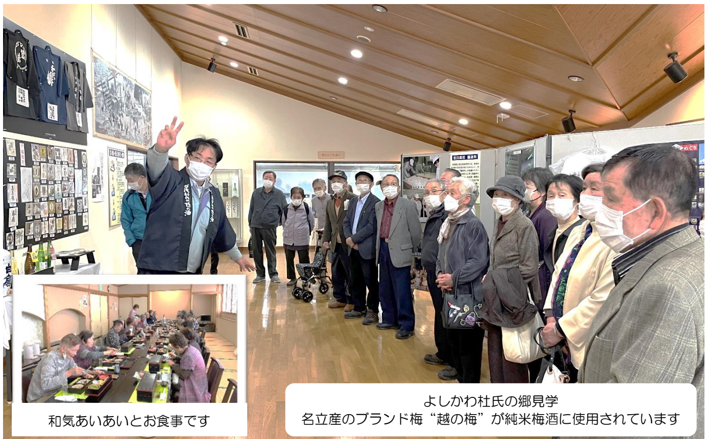
和気あいあいとお食事です