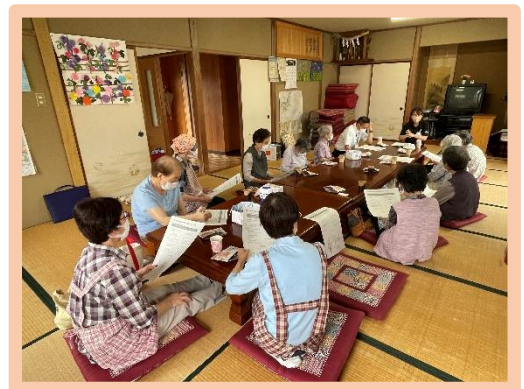
名立区内8カ所で開催している ふれあいいきいきサロン 【上記は赤野俣地区のすみれ会】