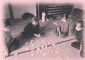
サロン三竹沢 脳トレゲーム

身近な地域で気軽に集えるサロンの設置を進め、仲間づくりの輪を広げ、生きがいづくりや社会参加を促進する活動の支援を行っています。