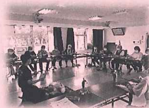
大島お達者クラブ 東頭消防署講座 “救急時の対応について”

大島地区公民館でサロン活動者交流会を予定しています。サロンの開設等にご興味ある方はご参加ください。ご連絡お待ちしております。(☎594-7107)