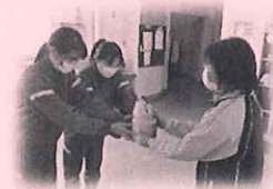
大島中学校生徒代表による贈呈