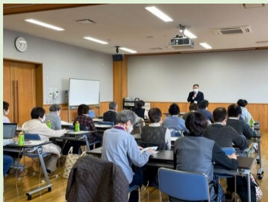
【沢田グループ長による講話】