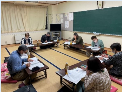
【R4.10.11 会場：不動地域生涯学習センター】