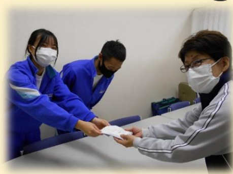
【名立中学校生徒代表による贈呈】

10月28日に名立中学校、12月14日に宝田小学校から、上越市共同募金委員会名立分社会福祉協議会名立支所）に赤い羽根共同募金をお届けいただきました。「地域のために役だてて欲しい」というみなさんの思いをしっかりと受けとめて、大切に活用させていただきます。大変ありがとうございました。