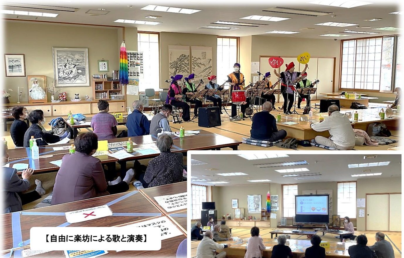
【自由に楽坊による歌と演奏】