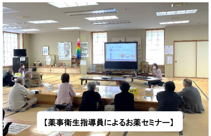
【薬事衛生指導員によるお薬セミナー】

11月14日（月）、ろばた館において、名立区住民福祉会主催、上越市社会福祉協議会名立支所共催の令和4年度第1回高齢者ふれあい交流会が開催されました。