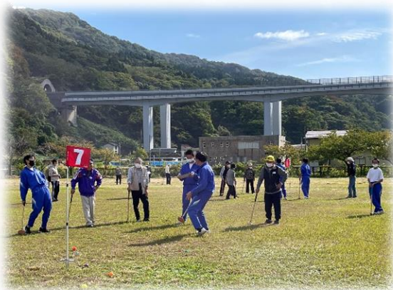
【2022 なたちグラウンド・ゴルフ交流会 競技中の様子】