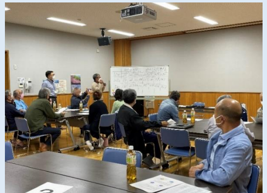
【R4.10.20 会場：名立地区公民館】