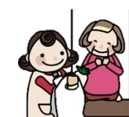
ほっと安心生活サポーター