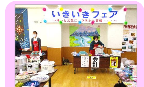
イベントのお手伝い