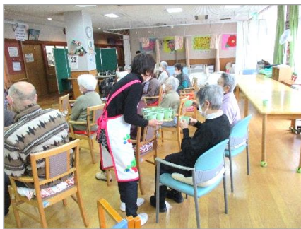
デイサービスボランティア