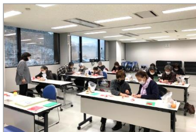
サロンボランティア