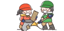
災害ボランティア