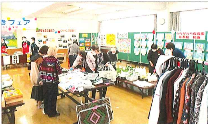
1階を会場に、チャリティ販売を行いました。

参加いただきました皆様、またお忙しい中、ボランティア・スタッフとしてご活躍いただきました皆様、地域の方々から見守り支えていただきありがとうございました。