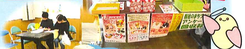
アンケートに答えて 抽選会参加!