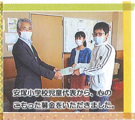
安塚小学校児童代表から、心のもった募金をいただきました。

この募金は、安塚区の地域福祉事業や県内の社会福祉施設や団体の行う福祉活動、災害支援に活用させていただきます。