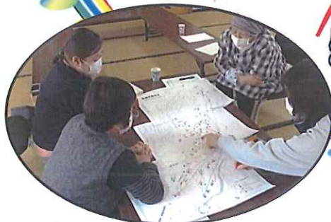
支え合いマップづくり