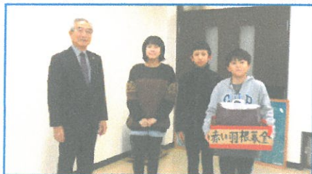
・清里小学校さん