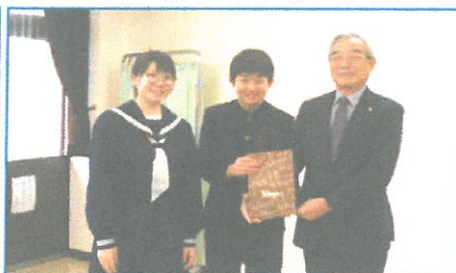
・清里中学校さん