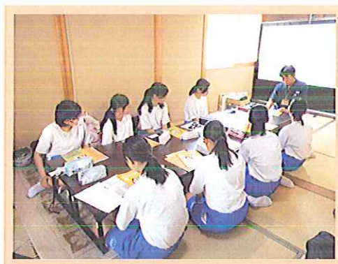
令和元年7月25、26日、椿寿苑において、中学生ボランティア教室として、認知症サポーター養成講座を開催しました。