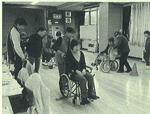
車いす介助や車いす乗車体験の様子

11月12日(火)のボランティア研修・交流会では、“介護のきほん”について研修しました。介助する人が力の限り頑張るのではなく、介助される人の力を引き出す介助のポイントや車いす操作・乗車体験、高齢者が起こしやすい事故等の対応方法など、ご参加いただいた皆さんは、熱心に取り組まれていました。