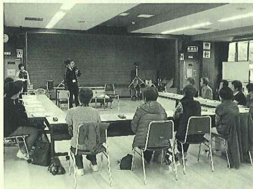
「手すりや歩行補助用具の説明」 エフビー介護サービス様 協力