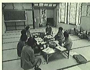
(旭地区ボランティア情報交換会)

子どもから大人まで、また地域の企業や団体等を対象に、福祉やボランティアへの理解を深める活動の支援を行い、自主的に福祉活動推進に取り組む人材の育成につなげていきます。