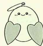
社協マスコットキャラクターぬくりん

上越市社会福祉協議会 大島支所 上越市大島区岡 3388-1 (大島地区公民館内) 電話 594-7107 不在時は 599-3878