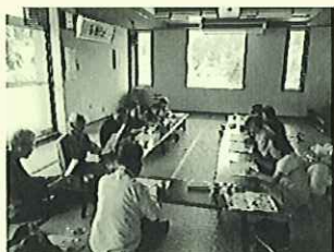
(大島お達者クラブの様子)

身近な地域で気軽に集い、参加者が主体となって自主的に運営し、ふれあいを通して生きがいがづくりや健康増進を図ります。活動費の助成、レクリエーション等の支援も行います。