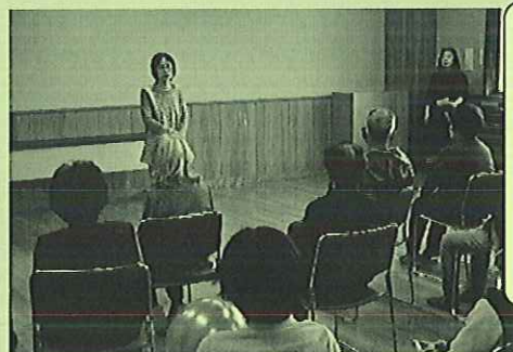
「三浦代表あいさつ」