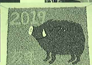
【ご利用者みなさんで作製した干支】