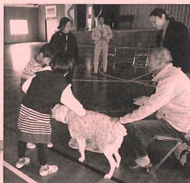
浦川原小学校5年生