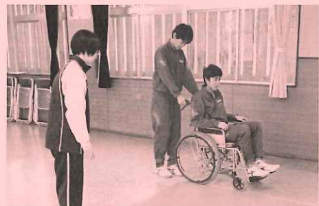
浦川原中学校3年生