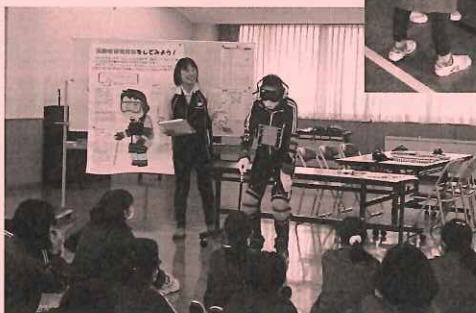
浦川原小学校6年生