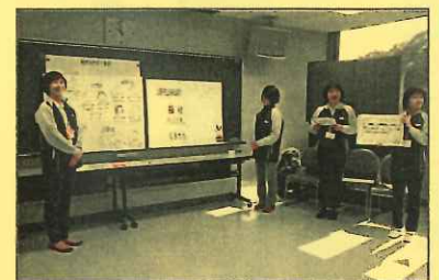
社協事業紹介の様子