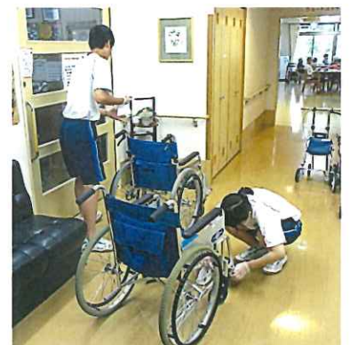
サマボランティア体験会