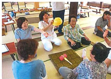
ふれあいいいききサロン