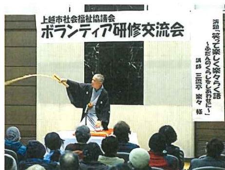
ボランティア研修交流会