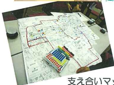
支え合いマップづくり