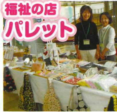
障がい者が作った商品を販売します。