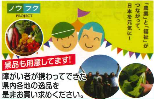
「農産」と「福祉」が つながって、 日本を元気に! 障がい者が携わってできた 県内各地の逸品を 是非お買い求めください。

新潟県農福連携マルシェ2018 「農業」と「福祉」が つながって、 日本を元気に!