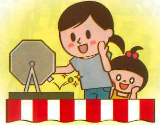
アンケートに答えて豪華景品が 当たる抽選会を開催します。

※時間・イベント内容は変更となる場合がございます。 ※各会場で席は充分用意しておりますが、万が一満席の場合は入場をお断りする場合がございます。