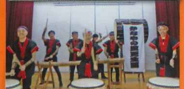
上越福祉会 かなやの里 更生園 太鼓クラブ 遊遊太鼓