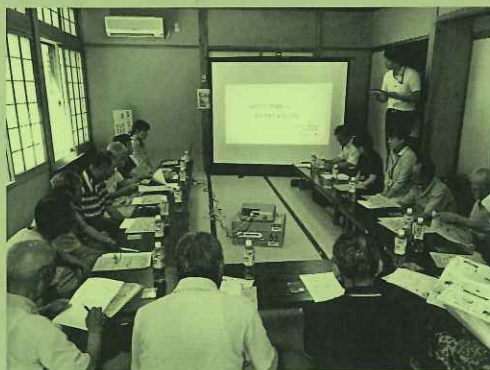
【上名立地区会場 地域ケア会議の様子】