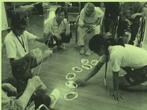
【デイサービスセンターでの体験】