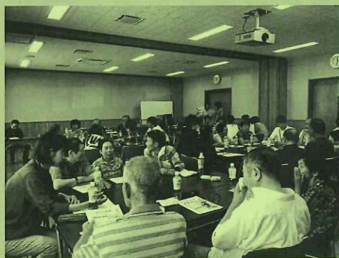
【北部地区会場 地域福祉懇談会の様子】

外出支援について現在の状況は、自分で運転ができる方や家族やご近所にお願ひしているのではありませんが、数年後は支援が必要になると思うので仕組みづくりをしてほしいとの意見がありました。 これらについて、集まった課題を整理し、関係機関に繋げ、検討し、安心して暮らすことができるまちづくりを目指して