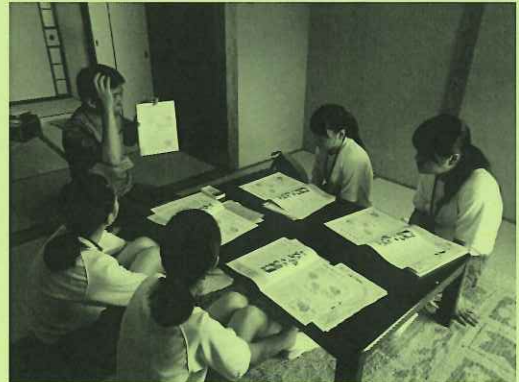
【講座「認知症を知ろう！」】