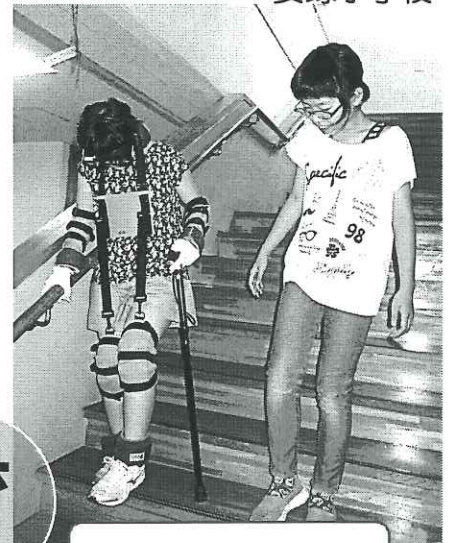
高齢者疑似体験の様子