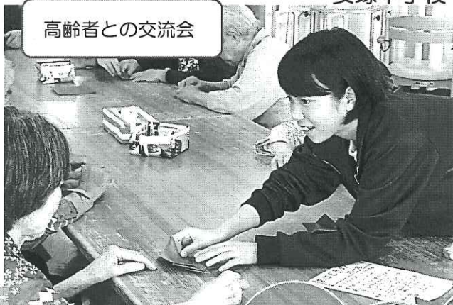
高齢者との交流会