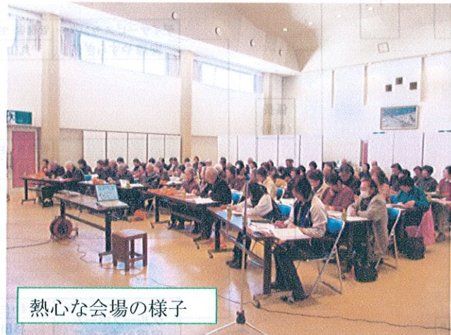
熱心な会場の様子