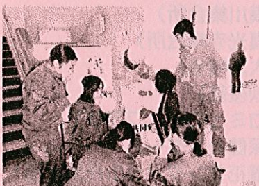
中学生からもボランティア 参加いただきました。

また、ワークセンターおおすぎのさとの製品即売や福祉の店パレットの移動販売、介護用品の展示・相談、デイサービスやすずらんの会の活動紹介・作品展示もありました。