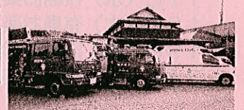
救急車・消防車が集合!

チャリティ販売では、寄贈物品のお願いをしたところ、延べ42人、446点の品物をご寄贈いただき、53,495円の売り上げをあげることができました。取りまとめをお願いしました町内会長様をはじめ、ご寄贈くださいました皆様に心よりお礼申し上げます。