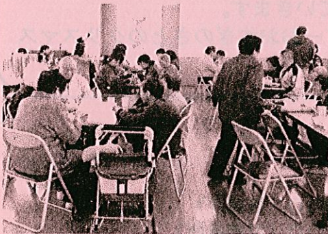
大好評でした。顕聖寺かあちゃんのうどんの店