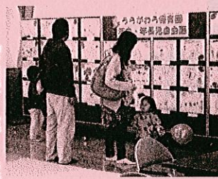
うらがわら保育園 年中・年長児自由画