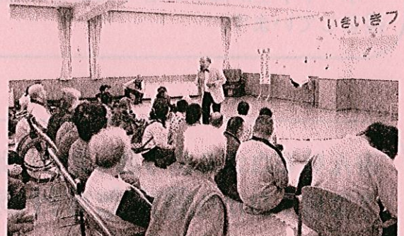
がんちゃんのトーク&歌謡ショー