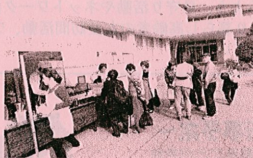
初お目見え 社会福祉協議会職員手作りによる マスコットキャラクターぬくりんの大判焼き