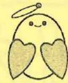
上越市社協マスコット めくりん