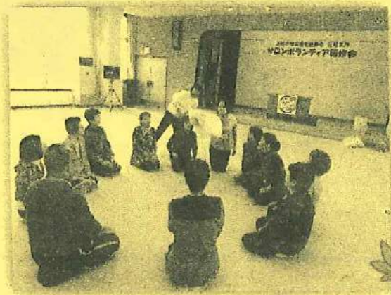
サロンボランティア研修会