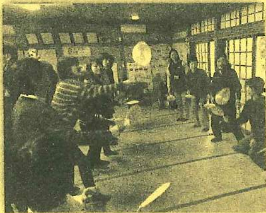
ふれあいいきいきサロン