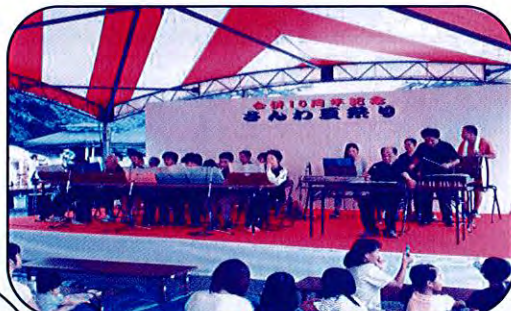
やまびこ会 楽器演奏