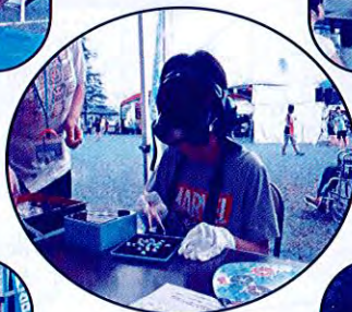
高齢者 疑似体験 に挑戦中