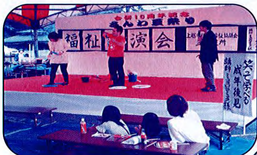
福祉講演会 by ミココロコミック