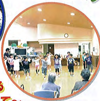
福祉協力校事業助成 (写真は美守小学校)