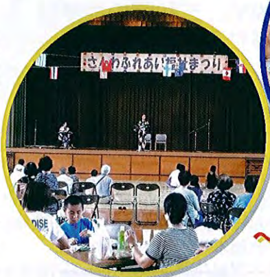
(さんわふれあい福祉まつり 24時間テレビ募金活動併催)