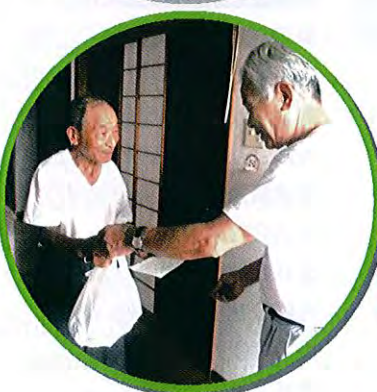
ふれあいランチサービス