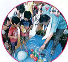
ふくし祭りに協力