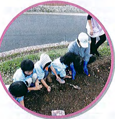
(さんわ世代間交流事業 保育園で花苗育成)

平成25年度も多くの皆さまから、福祉事業にご理解・ご協力いただきありがとうございました。 来年度も「誰もが安心して暮らせる心豊かな地域社会づくり」を目指して、努力させていただきますので、よろしくお願いいたします。