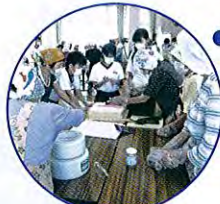
押し寿司づくりの集い