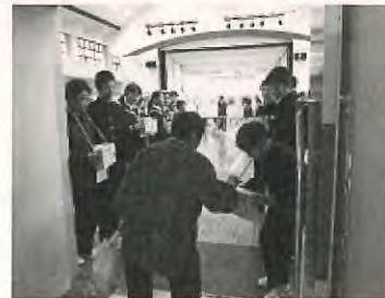
10/21 大島きらきら フェスティバル会場

お寄せいただきました募金は、全額、新潟県共同募金会に送金し、来年度の大島区をはじめ、上越市や新潟県内の地域福祉事業に活用されます。募金いただいた皆様、募金活動を支えてくださった皆様に感謝申し上げます。