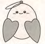
(社協マスコットキャラクターめくりん)

上越市社会福祉協議会 大島支所 上越市大島区岡 3388-1 大島地区公民館内 電話 594-7107 不在時は 599-3878