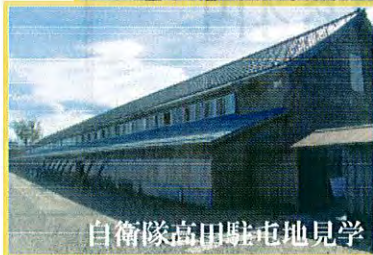
自衛隊高田駐屯地見学