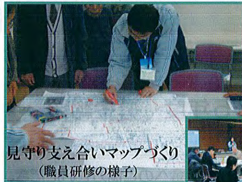
見守り支え合いマップづくり (職員研修の様子)