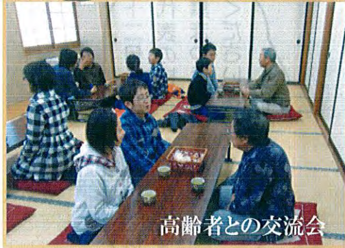
高齢者との交流会