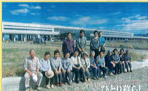
ひとり暮らし 高齢者の集い