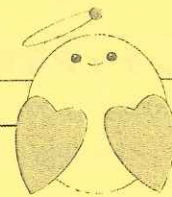
社協マスコット 「ぬくりん」