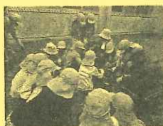
保育園児と高齢者との交流 (野菜の苗植え)