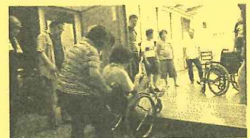
地域住民への福祉学習 (車イス講習会)