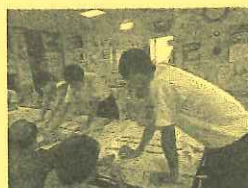
デイサービスでの 職業体験