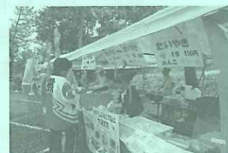
6/4（日）かっぱ祭り会場にて

第31回かっぱ祭りに参加し、恒例の「白いタイヤキ」を販売しました。今年度も皆様から好評で、沢山購入いただきました。ありがとうございました。