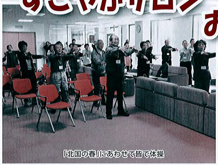
「北国の春」にあわせて皆で体操