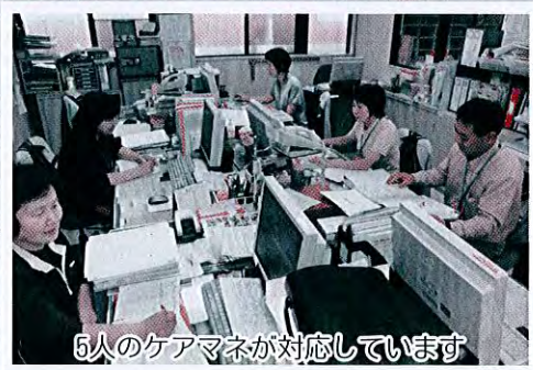
5人のケアマネが対応しています

皆様の介護の相談にのり、計画を作成しています。お困りの際はお気軽にご相談ください。