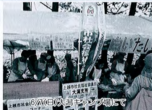
上越市社会福祉協議会 大潟支所 6/7(日)大潟キャンパスにて コーナー