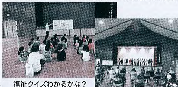
福祉クイズわかるかな？

11月7、14、21日の3日間にわたり、大潟町小学校1年生3クラスが1クラスずつ、福祉学習を兼ねてデイサービスセンターやすらぎの家の慰問に来訪し、デイサービス利用者には歌を披露し、一緒に遊び楽しく過ごしました。