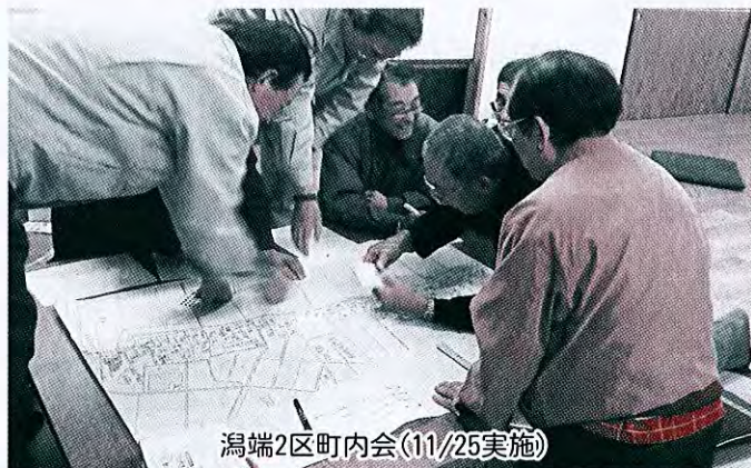
潟端2区町内会(11/25実施)