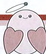
上越市社協マスコット 「ぬくりん」