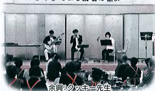
余興:クッキー先生