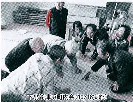
下小船津浜町内会(10/18実施)

今年度、下小船津浜町内会、潟端2区町内会の2地区で支え合いマップを作成しました。支え合いマップとは、住みよいまちづくりをめざして、住民のつながりを書き込んだ地図です。地域の支え合いの意識を高めるため、「お互いさま」の気持で、支え合い・助け合っていく「助けあい起こし」にマップを活用していただきます。来年度も引き続きマップ作り事業を広めたいと考えています。取り組みを希望される町内会、またはお問い合わせだけでも結構ですので、ご連絡をお待ちしています。