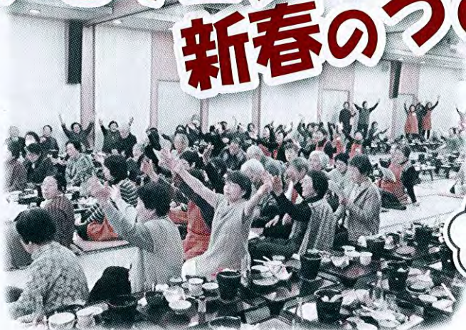
《2月19日 鶴の浜ニューホテルにて》