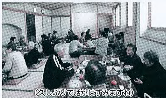
(久しぶりで話がはずみますね)

11月26日、お一人で生活している高齢者の方を対象にした交流事業「高齢者のつどい」を開催し、26名の方々からご参加いただきました。隣の吉川区「ゆったりの郷」で、温泉とおいしい食事を楽しみ、帰りは近くの道の駅で買物を楽しみました。