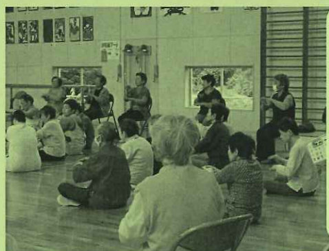
赤野俣地区「すみれ会」 名立園で交流会