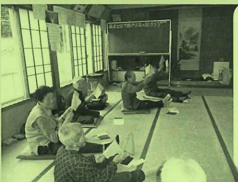
下瀬戸・西蒲生田地区 「集会所がお茶の間クラブ」 介護予防体操