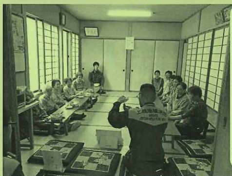
新井町地区「いずみ会」 名立分道所による防災講話

「ふれあいいいきサロン」は高齢者の閉じこもり防止や孤立の解消を目的に、地域のみなさんで作り上げる「誰もが」「気軽に」「楽しく」参加できる仲間づくりの場です。 名立区では、現在9か所を取り組まれており月1回程度開催されています。 みなさんの地域でも始めてみませんか？