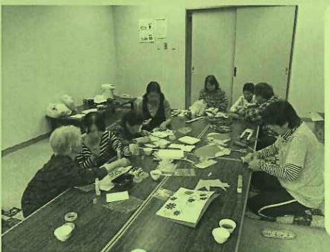
小田島・東蒲生田地区 「すずめの会」創作活動