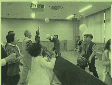
横町山・川地区 「横町いきいきサロン」 運動会