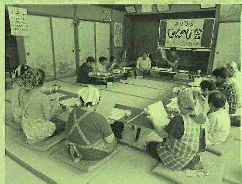
折平地区 「折平じよんのび会」 認知症予防講座