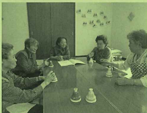
田野上地区「福寿会」 ハンドベル演奏