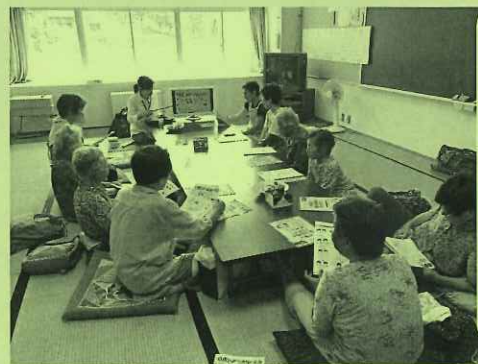
不動地区「喜楽会」 歯科衛生士による口腔ケア