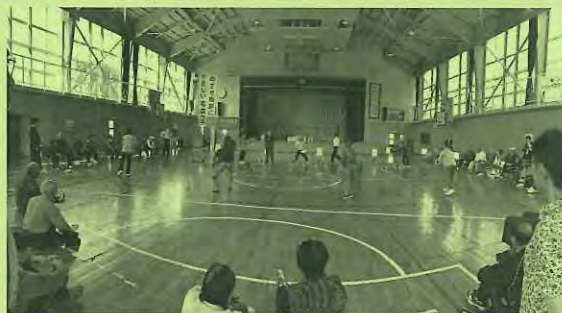
平成28年度名立区老連輪投げ大会

昨年50周年を迎えた名立区の4地区の老人クラブでは、いろんな活動を通じ、生きがいきり、健康づくり、仲間づくりを進めながら、地域づくり、地域の活性化にも貢献しています。私たちと一緒に活動しませんか！お待ちしております！！