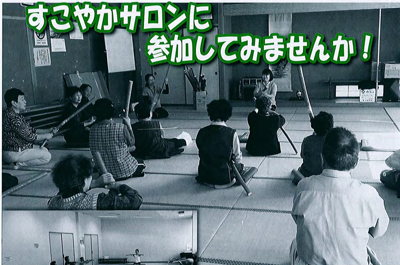
【出前サロン・円田荘会場】