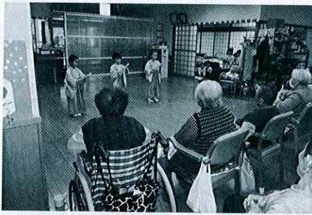
▲たちばな保育園様