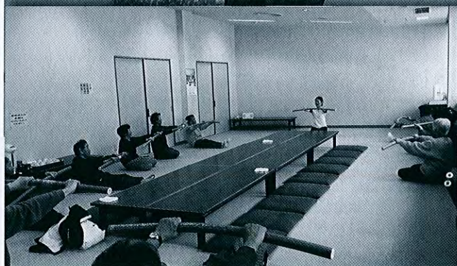
【出前サロン・ろばた館会場】

平成27年4月から地域支え合い事業が始まりました。名立地区公民館を拠点に「すこやかサロン」と「はつらつ健康運動教室」が開催されています。また、10月から出前サロンも2会場で開催されています。