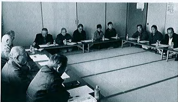
【下名立地区・円田荘会場】

今年度は、老人クラブの会員の皆様、また、日頃から地域福祉の推進にご尽力いただいている町内会長や福祉委員、民生委員児童委員の皆様からお集まりいただき、社会福祉協議会事業、今年度4月から実施しています地域支え合い事業や名立区の地域福祉事業等について、ご意見やご要望などをお聴きしました。