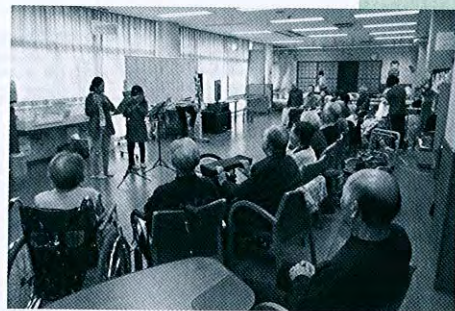
▲名立篠笛同好会様