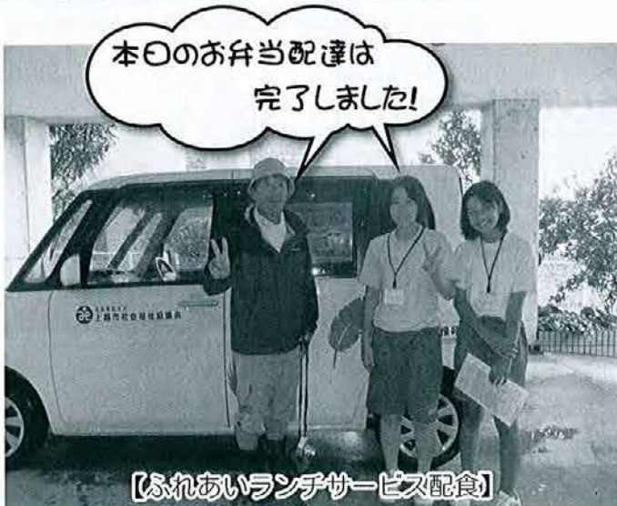
【ふれあいランチサービス配食】