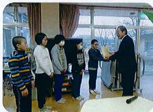
宝田小学校から赤い羽根募金活動の浄財を共同募金会名立分会（椿寿苑内）に届けていただきました。福祉活動に大切に使用させていただきます。大変ありがとうございました。