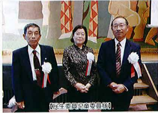
【民生委員児童委員様】

今年度の上越市社会福祉大会に於いて、社会福祉や地域福祉、在宅福祉、ボランティア活動等の功績により名立区では次の方が表彰されました。