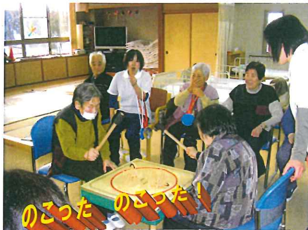
紙相撲対決(はっけよい)