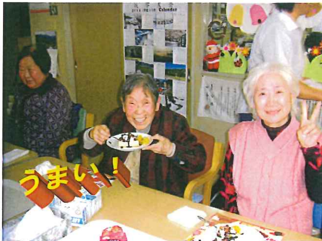
美味くてピースサイン