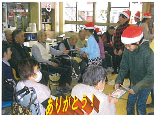
プレゼントをもらって(うれしい)