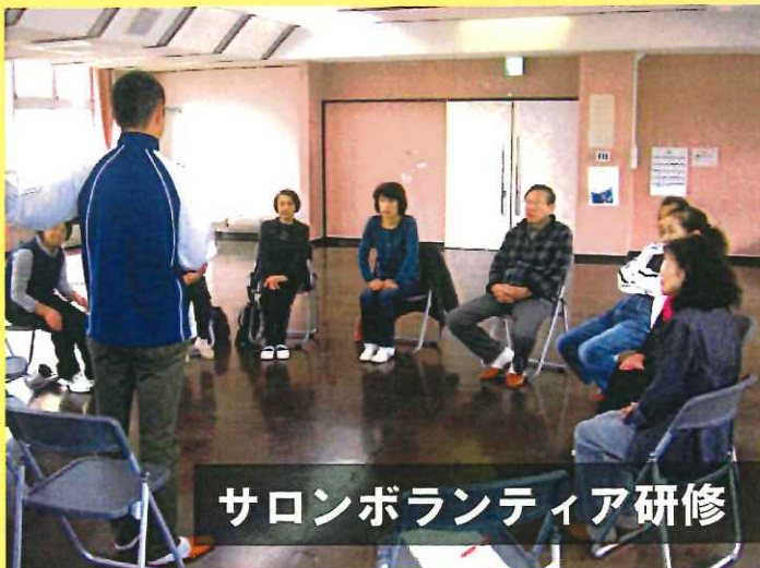
サロンボランティア研修