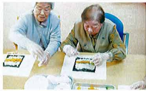
おいしい手巻き寿司