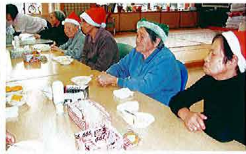
メリークリスマス