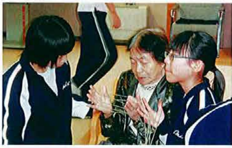
中学生とのあやとり、熱が入ります。