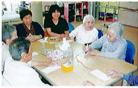
楽しい、たのしい七夕

デイサービスセンターやまゆりの家では、ご利用の方が可能な限り自宅において、その方の状態や能力に応じて自立した生活を営めるように、送迎に始まり、入浴や排泄、機能訓練、昼食等のサービスを提供させていただいております。